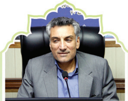
مدیرکل محیط زیست استان فارس مطرح کرد: