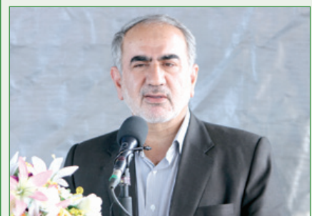
نماینده شیراز و عضو کمیسیون برنامه و بودجه مجلس:

ملت را قربانی ناکارآمدی ایران خودرو و سایپا کرده‌ایم