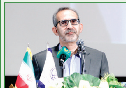
رئیس دانشگاه علوم پزشکی شیراز:

برای تبیین مؤثر، شبکه‌های اجتماعی رافع فیلتر کنیم