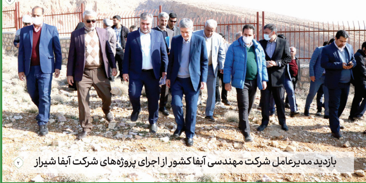
بازدید مدیرعامل شرکت مهندسی آبفا کشور از اجرای پروژه‌های شرکت آبفا شیراز

فارس در سه حوزه کشاورزی، صنعت و به ویژه آب آشامیدنی دچار مشکل است