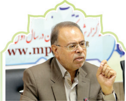
رئیس سازمان مدیریت و برنامه‌ریزی استان خبر داد:

طرح مالیات بر عایدی سرمایه راه ایجاد تعادل در بازارهای مالی است